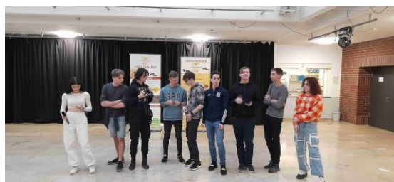
skupina našich žáků ve Viechtachu