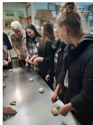
společné aktivity v muzeu chleba

Na konci května 2023 proběhl tradiční družební den s partnerskou školou Lyceum Karola Miarki Żory, tentokrát v Orlové. Během seznamování vyzkoušelo formou jazykových kvízů česko-polskou slovní zásobu. Pak jsme navštívili společně Farmu Bezdínek v Dolní Lutyni a kostel svatého Petra z Alkantary v Karviné, známý pod názvem „šikmý kostel“.