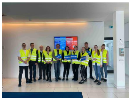
ze zahraniční praxe v Norheimu

V evropském projektu „Mobilitou k posílení kompetencí žáků na měnícím se regionálním trhu práce“ realizovalo své odborné praxe ve dnech 7. 5. až 27. 5. 2023 celkem 20 studentů naší školy. Již tradičně zamířili na 3 týdny do německého Northeimu, irského Dublinu a estonské Narvy. Pobyt studenty obohatil o nové pracovní, interkulturní a cestovatelské zkušenosti, posílil jejich jazykové dovednosti v anglickém a druhém cizím jazyce a ověřil jejich samostatné fungování v cizím prostředí.