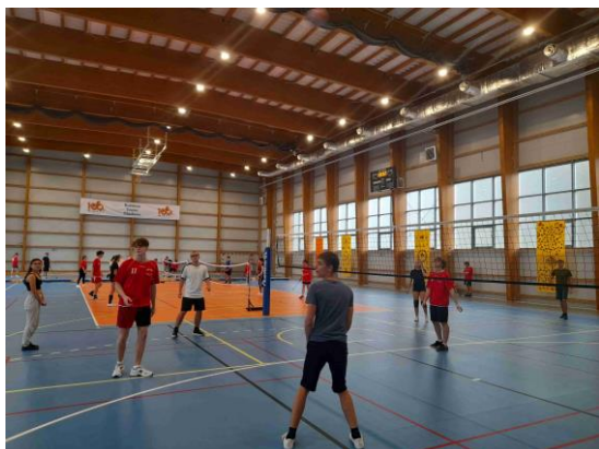
ze setkání v Żorach

16. 11. 2022 jsme navštívili další družební školu - Lyceum Karola Miarki Żory, se kterou orlovská obchodní akademie spolupracuje neuvěřitelných 30 let. Během návštěvy lycea jsme měli možnost ověřit si vzájemně znalosti češtiny a polštiny v zábavném kvízu, porovnat své fyzické síly a zdatnost ve sportovních aktivitách a také poznat další turistickou zajímavost u našich sousedů – Muzeum chleba v Radzionkově.