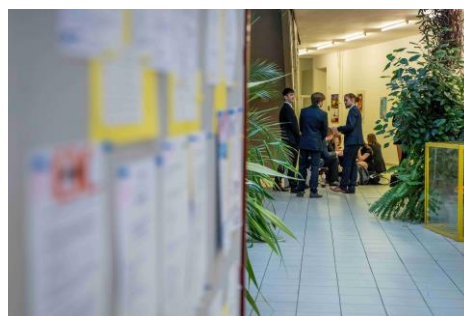
z akce Konkurs pro Tebe