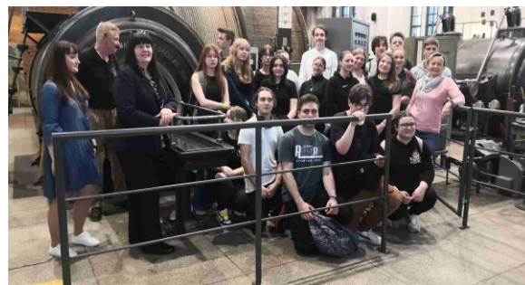
u nejstaršího funkčního parního šachetního výtahu

16. 11. 2022 jsme navštívili další družební školu - Lyceum Karola Miarki Żory, se kterou orlovská obchodní akademie spolupracuje neuvěřitelných 30 let. Během návštěvy lycea jsme měli možnost ověřit si vzájemně znalosti češtiny a polštiny v zábavném kvízu, porovnat své fyzické síly a zdatnost ve sportovních aktivitách a také poznat další turistickou zajímavost u našich sousedů – Muzeum chleba v Radzionkově.