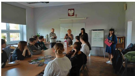
z přivítání v Rydułtowach

Naše škola dlouhodobě spolupracuje s družebními středními školami v Pszowe, Rydułtowach a v Żorach. Během školního roku 2022/2023 jsme navštívili družební školu v Rydułtowach, kde jsme se společně i se zástupci školy ze Pszowa 21. 4. 2023 seznámili na virtuální střílnici s manipulací a střelbou na virtuální terče. Po prohlídce školy jsme se přemístili do muzea v dole Ignacy ve městě Rybnik.