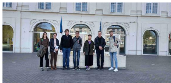
ze zahraniční praxe v estonské Narvě