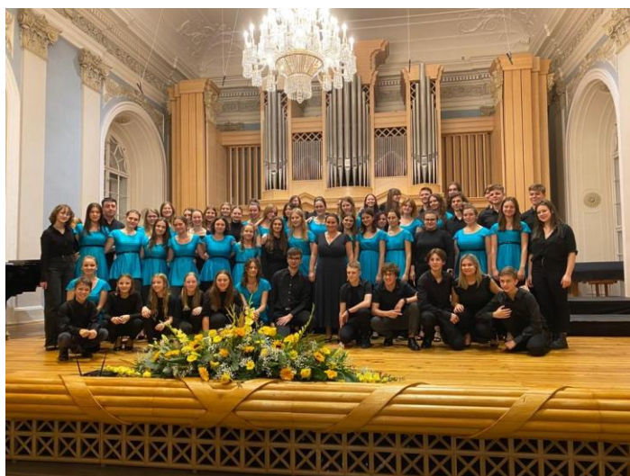
naši vítězové na festivalu Musica Orbis Gloria

Náš pěvecký sbor se přihlásil na Ohridský festival pěveckých sborů do Severní Makedonie. Festival se konal od 24. do 27. srpna 2023 ve městě Ohrid. Na festivalu jsme soutěžili v mládežnické kategorii s dalšími sbory ze Srbska, Maďarska nebo Moldavska, a dokonce i několika českými sbory – konkurence byla opravdu vysoká, a proto jsme nesmírně vděční, že náš výkon byl nakonec porotou ohodnocen 90 body ze 100 a zlatým pásmem! Z Makedonie jsme odjžděli nadšení a spokojeni.