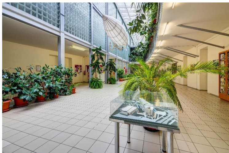
foto - hlavní atrium

Na počátku školního roku 2020/2021 ve 24 třídách denního studia studovalo celkem k 3. 9. 2020 637 žáků. Ve 12 třídách osmiletého i čtyřletého oboru vzdělání gymnázium 339 žáků, ve 12 třídách denního studia odborného vzdělávání 297 žáků.