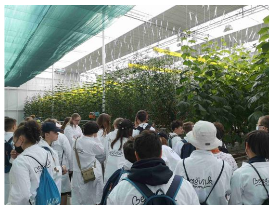
exkurze na farmu Bezdínek