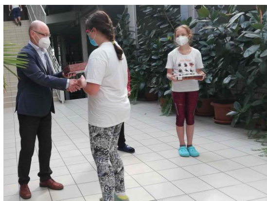
z ocenění Fotosoutěže pro primu